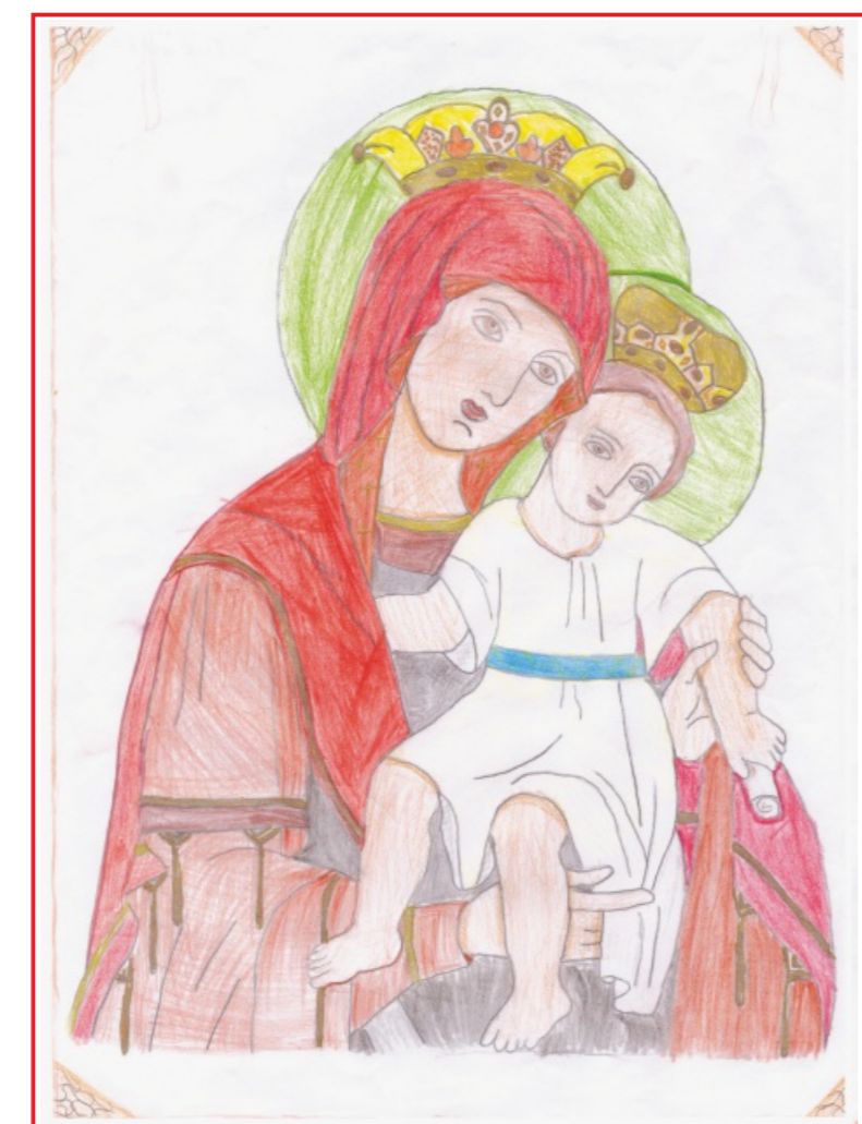
Рисуника: Алина Росенова Гаджева ОУ „Иван Вазов“, Русе

Авторски материали можете да изпращате на e-mail: viara_jivot@abv.bg