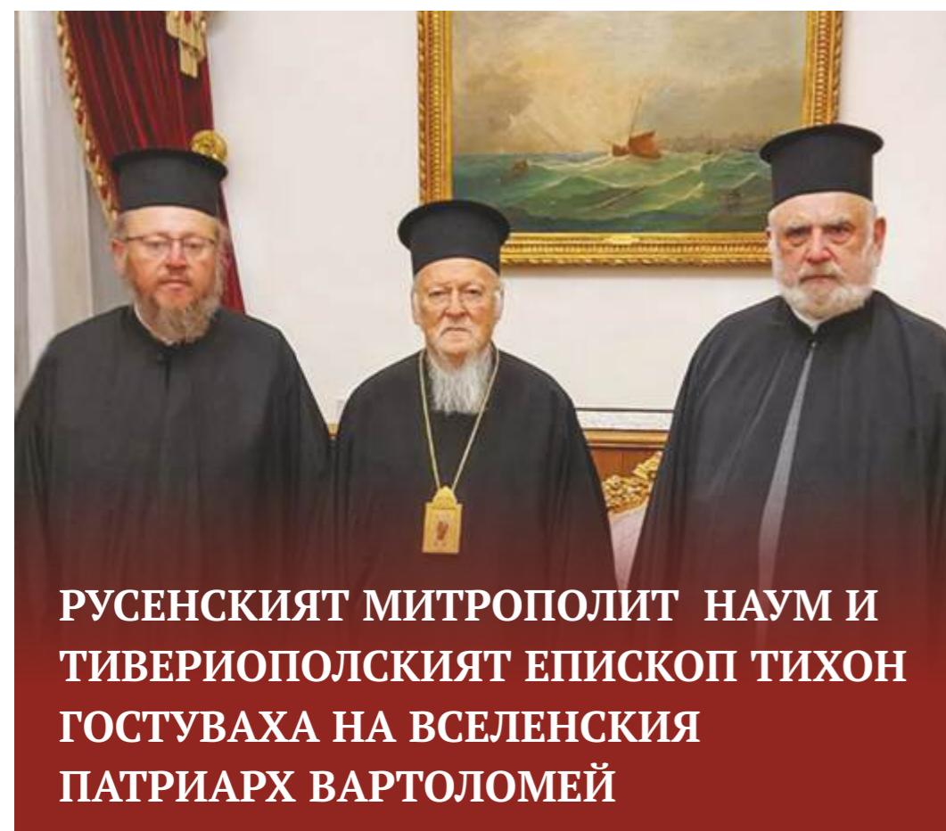
РУСЕНСКИЯТ МИТРОПОЛИТ НАУМ И ТИВЕРИОПОЛСКИЯТ ЕПИСКОП ТИХОН ГОСТУВАХА НА ВСЕЛЕНСКИЯ ПАТРИАРХ ВАРТОЛОМЕЙ

На 29 ноември 2021 г., в навечерието на Андреевден – празник на Константинополската патриаршия, Негово Светейшество Константинополският и Вселенски патриарх Вартоломей прие в Патриаршеската си резиденция в престолния си град (сега Истанбул) Негово Високопреосвещенство Русенски митрополит Наум и Негово Преосвещенство Тивериополски епископ Тихон, дошли да засвидетелстват своето уважение към председателя на Църквата-Майка. Патриархът и българските архиереи проведоха сърдечен разговор в духа на братска любов и внимание, обменяйки мисли по различни въпроси. На 30 ноември 2021 г. митрополит Наум взе участие в съборната света литургия в патриаршеския храм „Св. Георги“, в съслужение с Вселенския патриарх Вартоломей, митрополити от Св. Синод на Константинополската патриаршия, архиереи от Йерусалимската патриаршия и гр. ✦