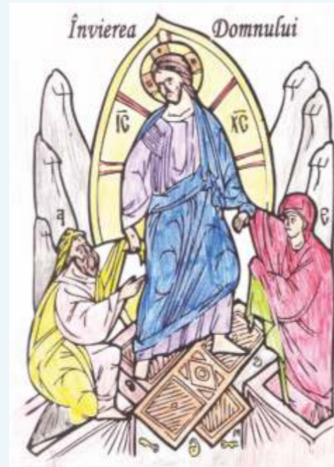
Pietraru Adelina, 10 г.