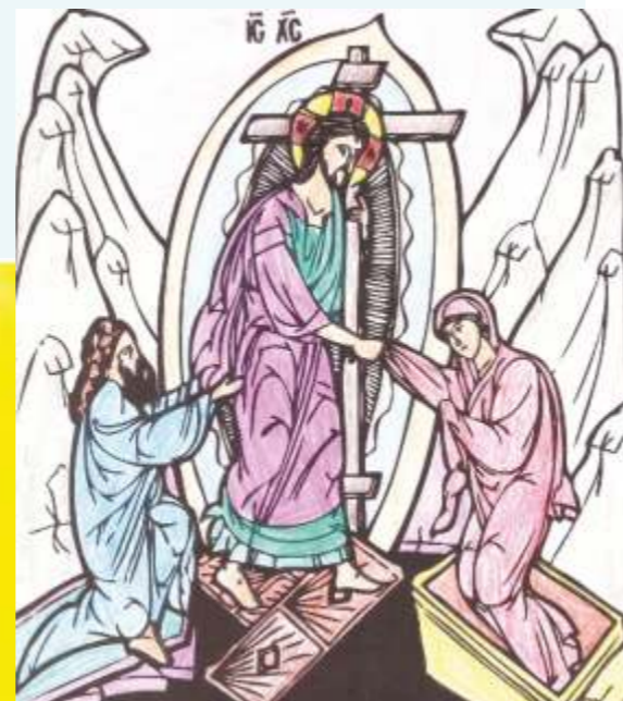
Tarus Laurentiu, 10 г.