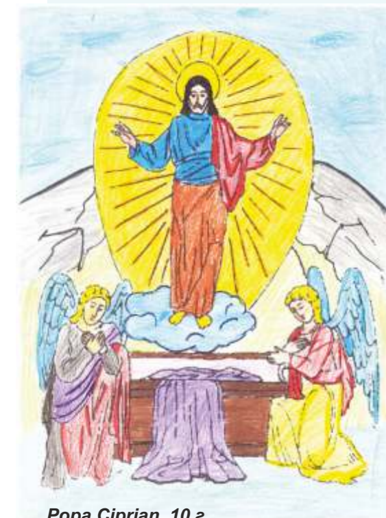
Pora Ciprian, 10 г.